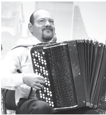
Коллектив Центра культуры Зырянского района

В юбилей желаем много: Счастья, радости, удач, Ровной чтоб была дорога, Меньше жизненных задач. Быть всегда в кругу любимых, Добиваться всех высот, Жить красиво, энергично, Процветать из года в год!