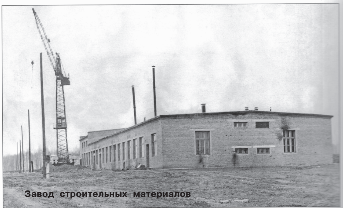
Завод строительных материалов

Из книги "Страна зырянская, родная" Н.Е.ФЛИГИНСКИХ