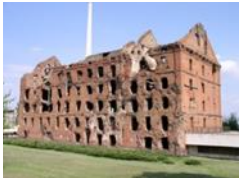
Дом сержанта Павлова

Свое имя — дом Павлова — эта обычная 4-этажка получила благодаря сержанту Якову Павлову, который командовал обороной этого здания в сентябре 1942 года.