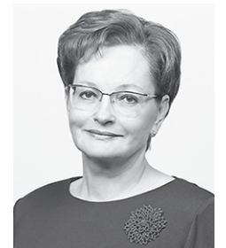
Председатель Законодательной Думы Томской области Оксана КОЗЛОВСКАЯ

От всей души желаем вам и вашим семьям крепкого здоровья, благополучия и дальнейших успехов в служении Отечеству!