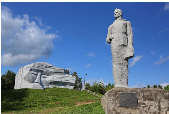
Памятник В.К. Арсеньеву

Наш адрес: 636850, Томская область, с. Зырянское, ул. Кирова, 16.