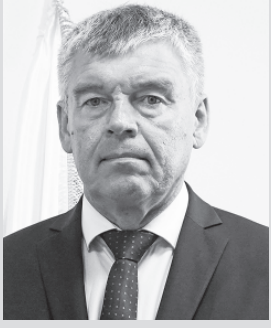
Уважаемые избиратели, жители Зырянского района!

10 и 11 сентября на территории нашего региона состоятся выборы Губернатора Томской области. В нашем районе пройдут ещё довыборы депутата Думы Зырянского района по избирательному округу №4, а также выборы депутатов пяти советов сельских поселений. В этот раз принять участие в голосовании можно будет, не выходя из дома, - через портал "Госуслуги". Это очень удобно. Особенно для тех избирателей, которые фактически проживают за пределами района, а в наших населенных пунктах только зарегистрированы - в районе таких избирателей более 30 процентов. Многие из них, к сожалению, в прошлые выборы не принимали участия в голосовании. Из-за этого мы показываем низкую явку, что может ошибочно говорить о нашем рав-