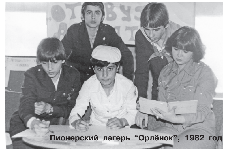
Пионерский лагерь "Орлёнок", 1982 год

После отпуска мы вновь вернулись в "Орлёнок", в ту атмосферу, где царит особый дух, присущий только этому лагерю, со своей историей, своими традициями и законами, где кипит творчество, как в пионерских, так и вожатских отрядах. Здесь мне пришлось поработать в трёх дружинах - "Стремительной", "Звёздной" и "Штормовой". Рада, что