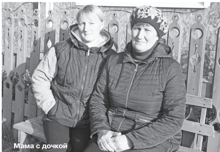
Мама с дочкой