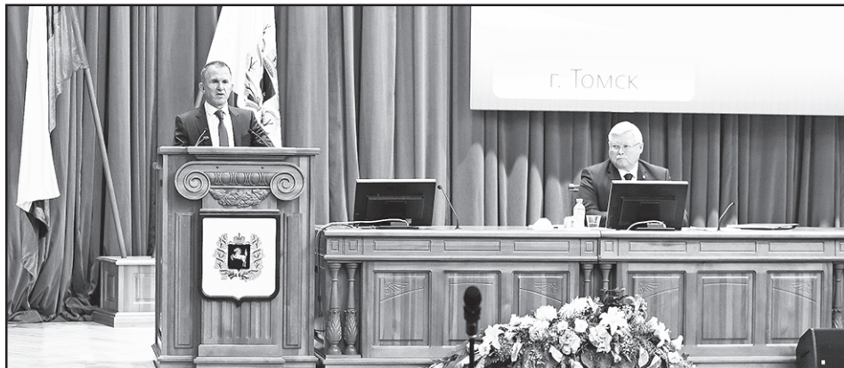
Сенатор Российской Федерации от Томской области Владимир Кравченко:

В результате тайного голосования большинством голосов Владимир Кравченко был переизбран на должность сенатора - представителя от Законодательной Думы Томской области. В Сенате интересы региона он защищает с 2016 года