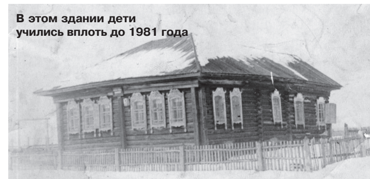
В этом здании дети учились вплоть до 1981 года

В 1950 году красноярские колхозы "Путь к социализму" и "Рассвет" сливаются в один - "Путь к социализму". Через семь лет, в ноябре 1957 года, члены сельскохозяйственных артелей "Путь к социализму" с. Красноярка и "Советская Россия" Окунеевского сельского Совета объединились в одну сельхозартель. В укрупнённую сельхозартель "Советская Россия", кроме Красноярки, вошли населённые пункты Чарочка, Тарбыково, Митюшкино и Усачёво. В начале 60-х годов прошлого столетия наряду с другими сёлами района укрупнение колхозов коснулось и Красноярки - она стала отделением Богословского колхоза им. XXII партсъезда КПСС.