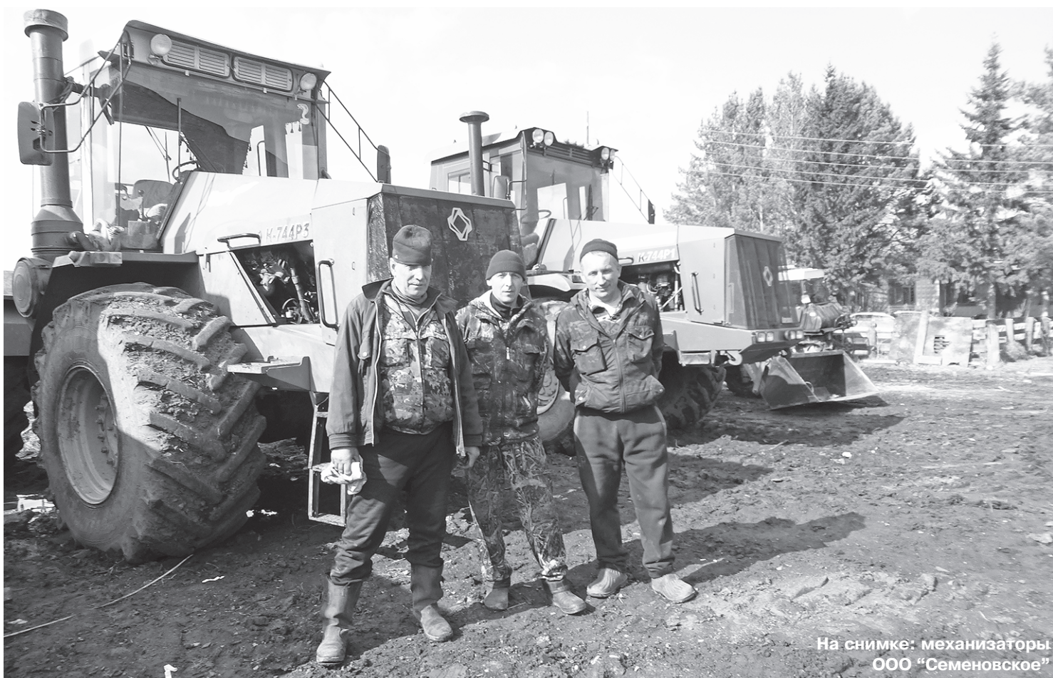
На снимке: механизаторы ООО "Семёновское"