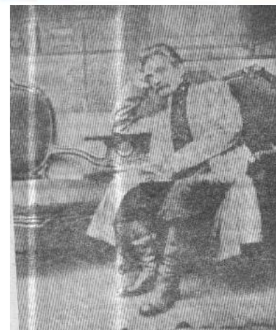
Митрофан Ефимович Пятницкий (1864 -1927)