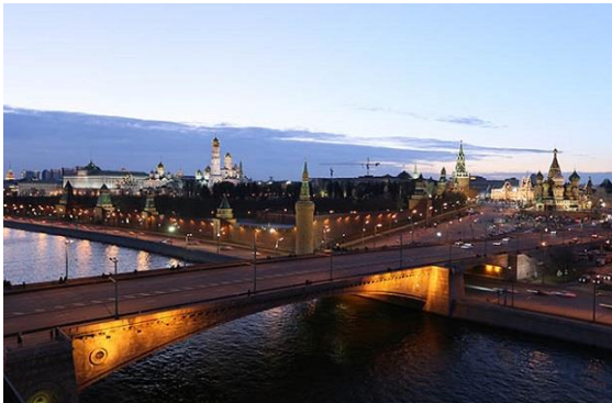
Ночная Москва

Акция заключается в том, что в этот день в назначенное время люди в разных странах мира на один час отключают свет и другие электроприборы.