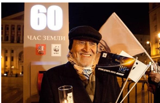
«Час Земли» — это, прежде всего, символическая акция бережного отношения к природе