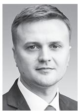
Депутат Госдумы РФ Алексей ДИДЕНКО

Искренних улыбок, крепкого здоровья, благополучия в делах и в семье! Пусть вас окружают внимание и забота! Будьте всегда счастливы и любимы!