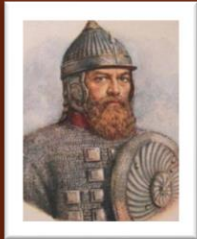
Пожарский Дмитрий Михайлович

Минин в трудную для России пору, когда поляки хозяйничали в Москве, когда Новгород был уже занят шведами выступил с призывом подняться на борьбу с врагами Родины. Он возглавил движение за создание нового ополчения, показал пример, отдав треть своего имущества на организацию народного войска.