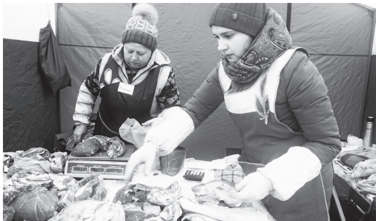
Окончание. Начало на стр.1

В межрегиональной агропромышленной выставке-ярмарке "Золотая осень. Урожай-2019" участвовали зырянцы