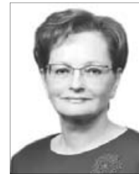
Оксана Козловская, председатель Законодательной думы Томской области