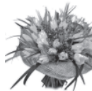
Твои муж, дети, родители.

Всего тебе мирного, доброго, ясного, Всего тебе светлого и прекрасного! Будь самой красивой, Будь самой любимой И самой счастливой будь!