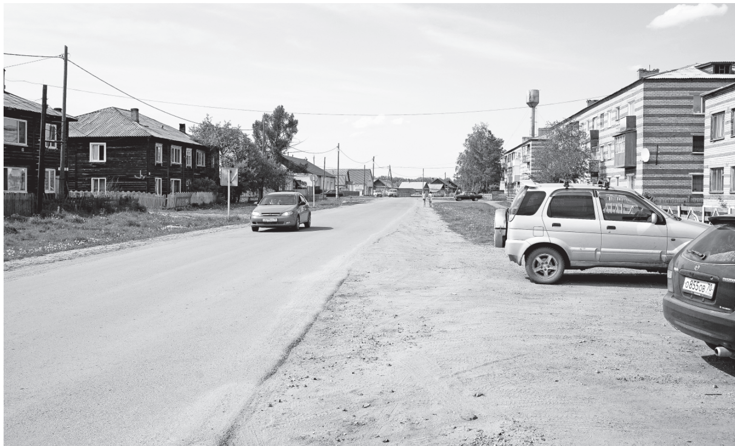
■ Ровный асфальт на улице Чапаева в райцентре