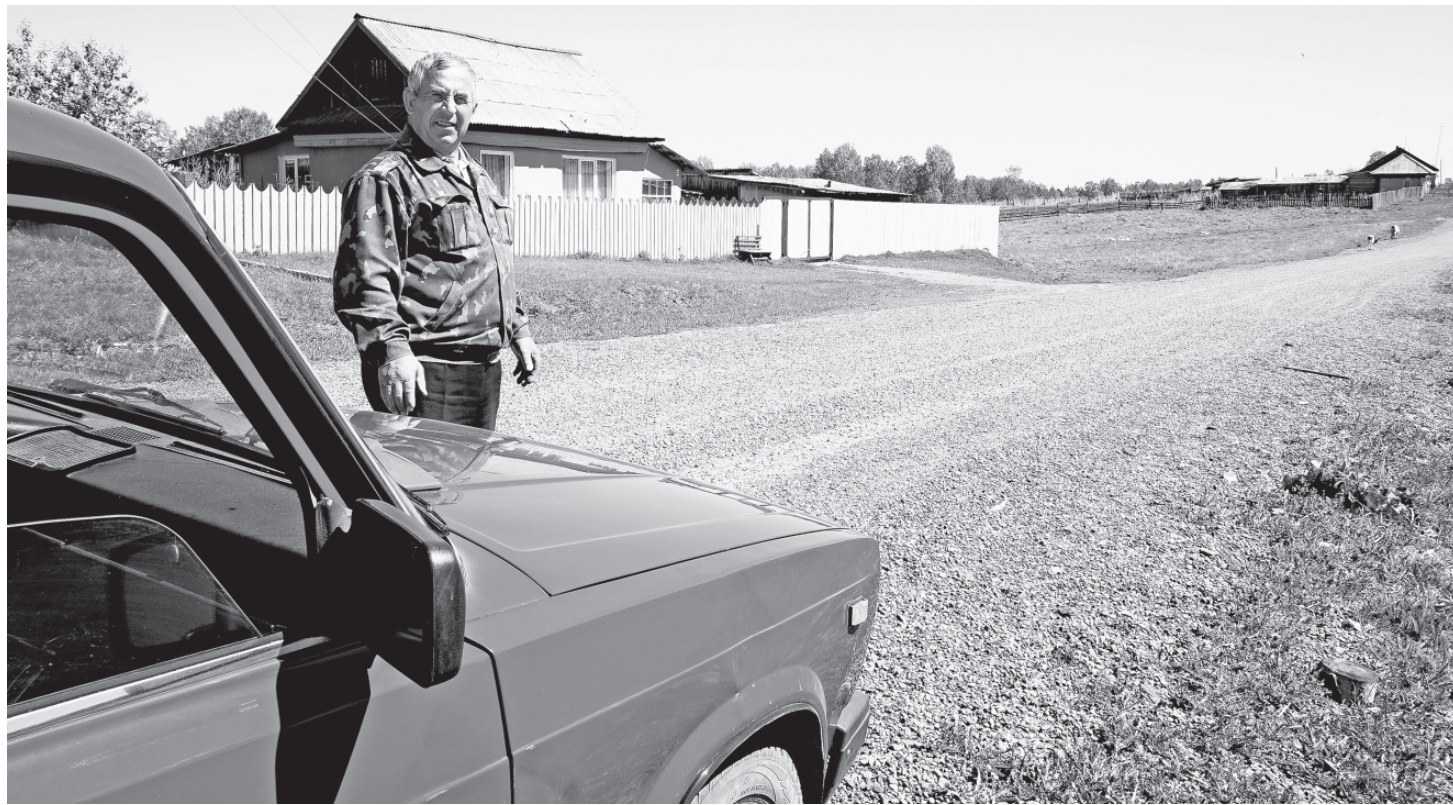
■ По отремонтированной дороге в селе Гагарино можно проехать на любом автомобиле и в любую погоду