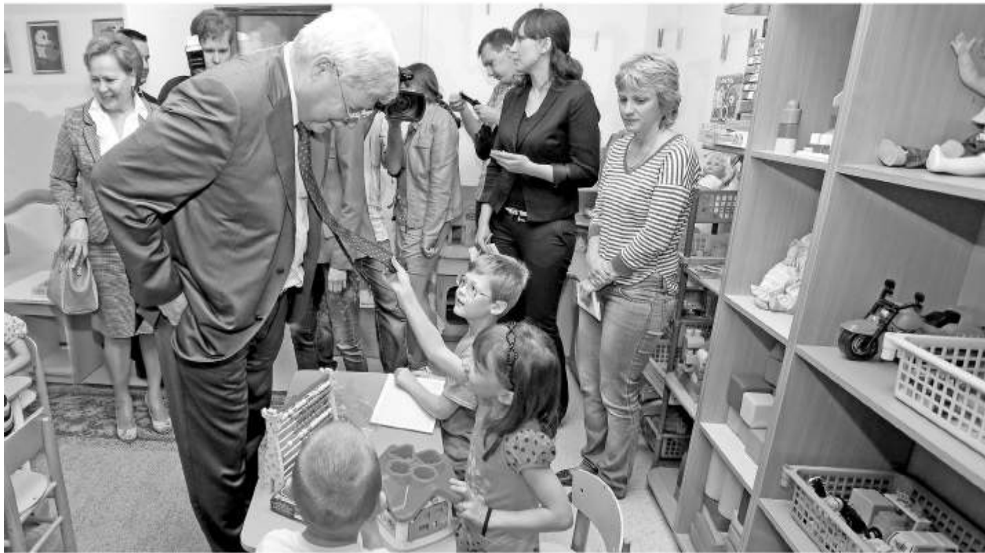
■ Теперь детских садов хватает всем самым маленьким жителям области