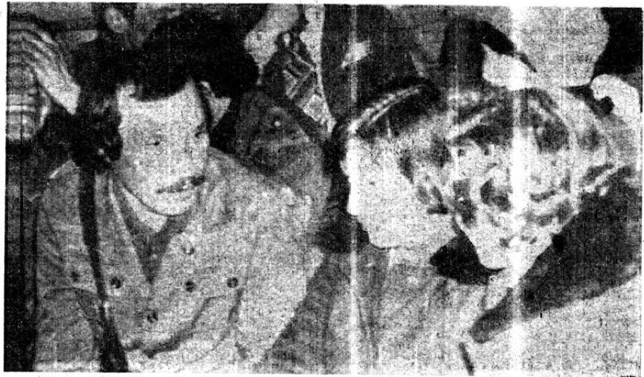
Члены отряда на встрече с зырянцами.